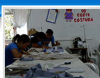
Aula prática do curso de Corte e Costura.

Curso realizado em parceria com a entidade não governamental SER – Serviços de Recursos de Emprego. Cerca de 140 jovens foram beneficiados.