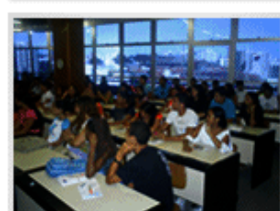
Visita dos alunos ao Fines Projeto ES Empreendedor