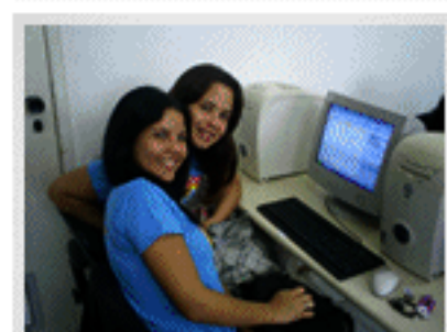
Aula de Inclusão Digital