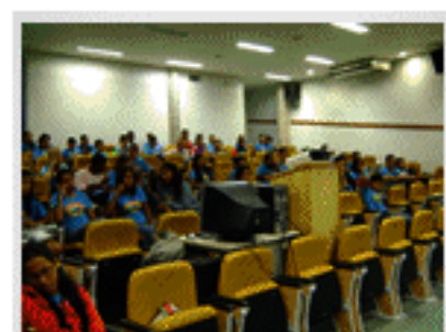
Seminário Atendimento ao Cliente