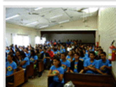
Encerramento Consórcio Social da Juventude