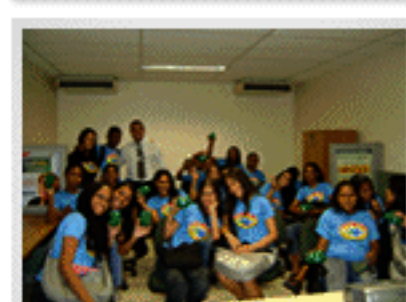
Visita à Dacasa Financeira