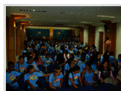
Seminário Mercado de Trabalho e Processo Seletivo